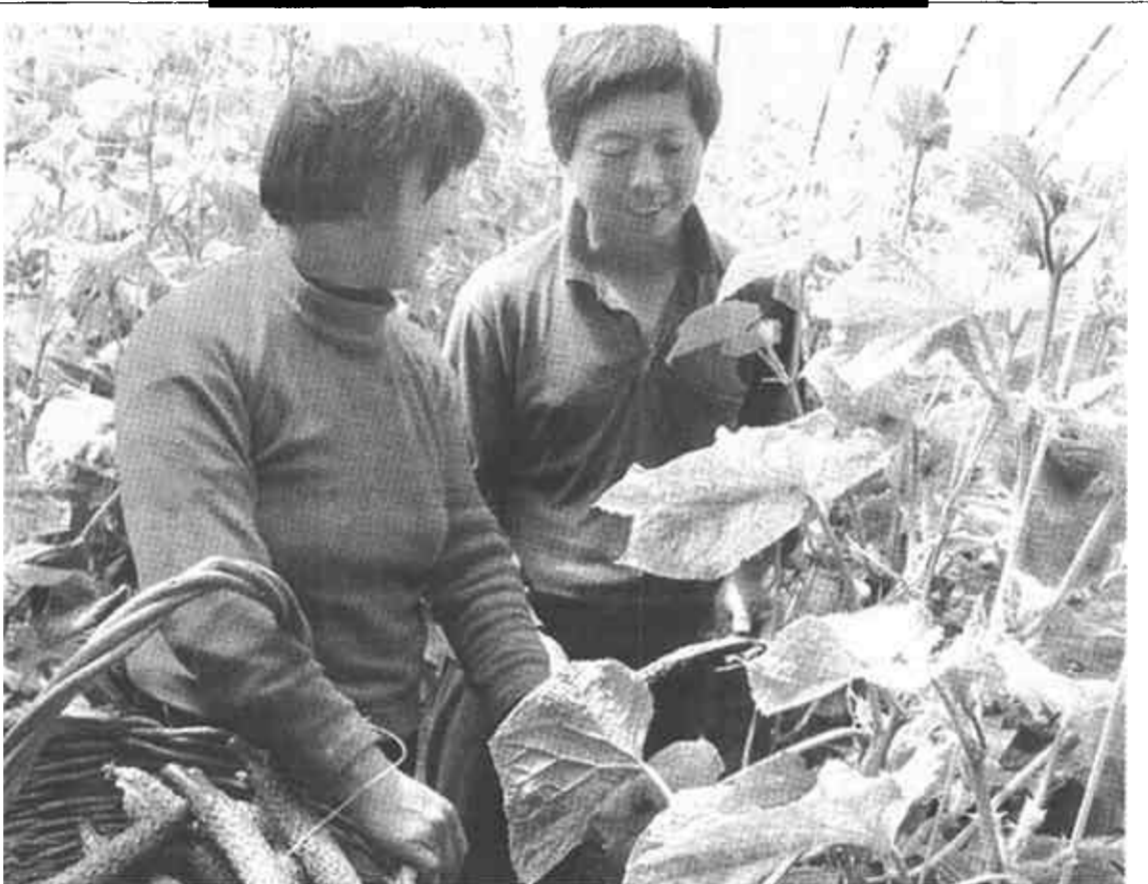
垦利县董集乡充分利用黄河滩区的资源优势，大力发展大棚蔬菜。目前，该乡在滩区发展的170余栋大棚蔬菜已进入收获期。

一年多以来，市建行包村工作组认真按照市委“强班子、找路子、办实事、帮民富”的总体要求，与东营区史口镇党委政府及元里村两委密切配合，加强了村级班子建设，密切了干群关系，引导农民转变思路，积极协调资金，解决村民关心的热点和难点问题，帮助农民大搞庭院种植、冬枣种植项目，将村民“扶上马，送一程”。