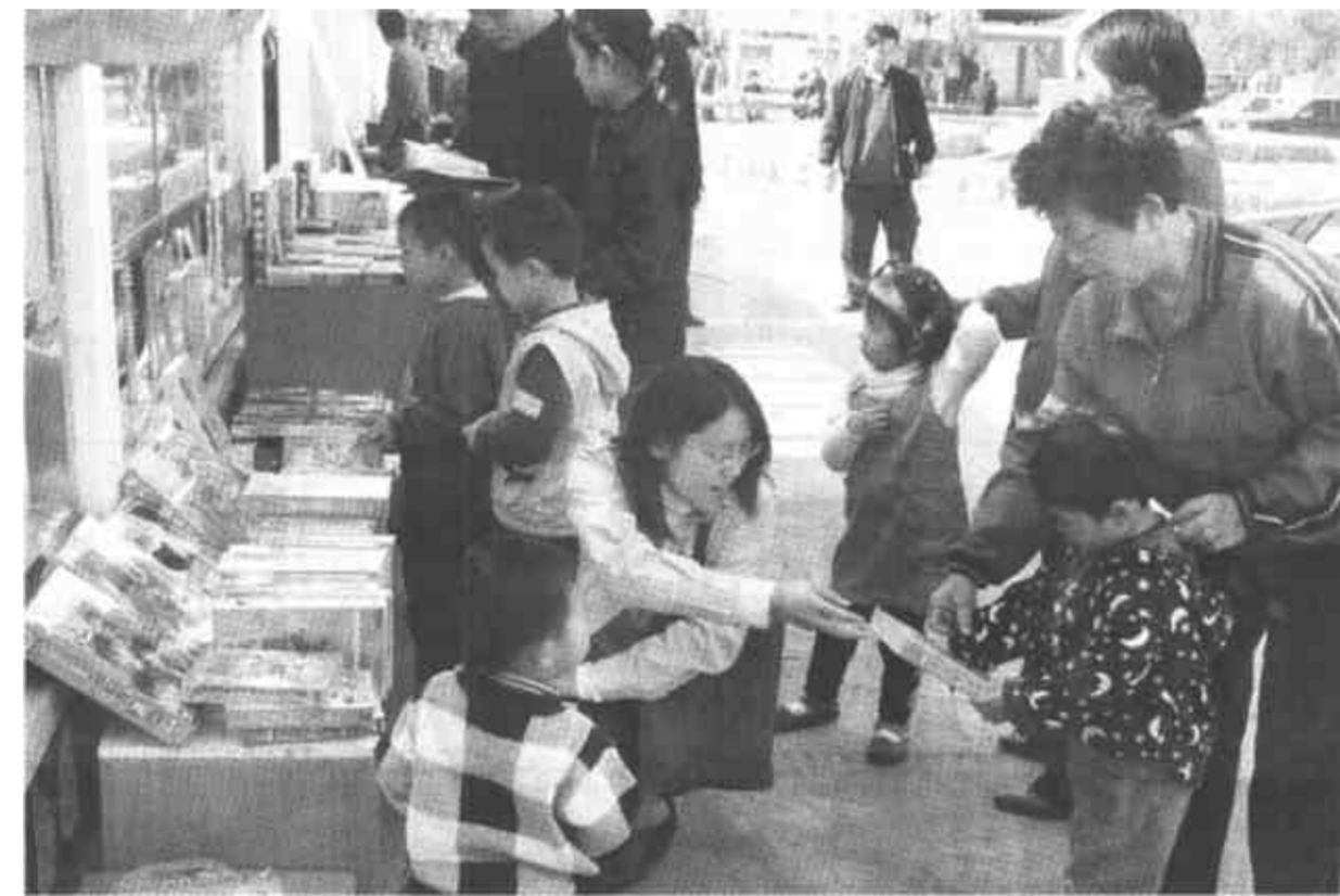
“五一”期间,市新华书店组织流动售书小组分赴居民区销售图书,既丰富活跃了居民节日生活,又增加了经济效益。

垦利讯 今年以来,垦利县人民法院执行局加大执行力度,对涉及金融单位的100余件借款合同纠纷案件进行了集中执行。在活动中,共传唤当事人200余人次,拘留被执行人3人,执结标的达100余万元,盘活了金融企业资金,维护了法律尊严,树立了该院“信用诉讼”的良好形象。(吴胜林)