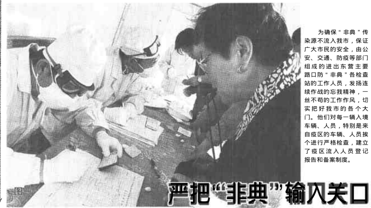
严把“非典”输入关口

垦利镇农业高科技示范园重点抓蟹、蟹和特色鱼养殖。对蟹养殖面积达到3.26万亩，年产对虾0.21万吨；河蟹养殖面积达到2.31万亩，年产成蟹580多吨，扣蟹8420万只。同时引进黑鱼、鲈鱼等特色鱼进行养殖。该园年经济总产值达5480万元，利税780万元。（志峰 学慧 明华）