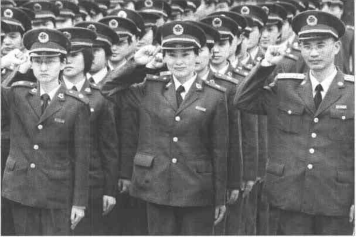
5月5日,解放军第二军医大学支援北京抗“非典”医疗队宣誓坚决打赢抗击“非典”战斗。当天,全军和武警部队支援北京小汤山“非典”定点医院的第三批313名医务人员抵达北京。至此,全军和武警部队支援小汤山“非典”定点医院的1200名医务人员全部抵达北京。

“个性化医疗”可通过研究患者体内发挥作用的基因和基因合成酶、激素等的差异,确定治疗和预防疾病的方法。如抗癌剂对一些患者疗效显著,而对另一些患者则可能产生副作用,如清楚容易引起副作用的特定基因,便可在预先调查患者基因的基础上,判断副作用的危险性,决定治疗方针。