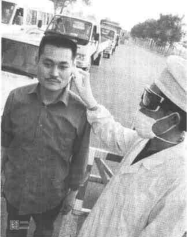
图一：对外来人员进行重点检测、登记、跟踪。 图二：检测人员使用德国博郎一秒体温计对进入我市人员逐一进行检查。（记者 崔丽英 摄）

辛店街道还采纳区政协建议，结合“双创”活动，及时总结推广经验，在全街道开展了“环境卫生治理”活动，各社区居委会整顿调整了卫生保洁站，实现了横到边、纵到底、无空隙保洁组织网络。区直城管部门则加大了对城居卫生管理监督力度，推进了全市“双创”工作的开展。（潘力 黄岗）